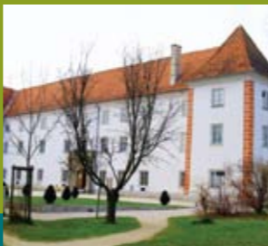
dvorec Murska Sobota